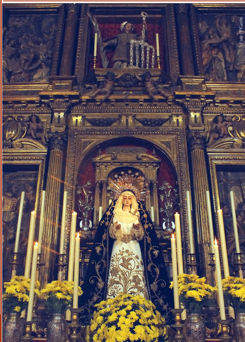
La Virgen en el Altar Mayor de la Parroquia

DIRECCIÓN: C/ Martínez Montañés, 19-21. 41002—Sevilla www.hermandaddelasoledad.org DEPOSITO LEGAL: SE-199-1972